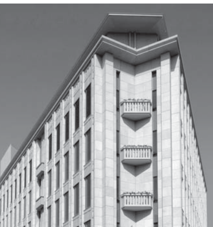
TISデータセンター「GDC御殿山」