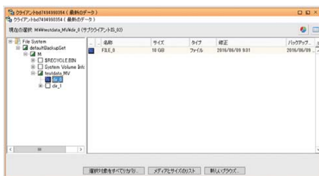
ファイル単位でのリストア