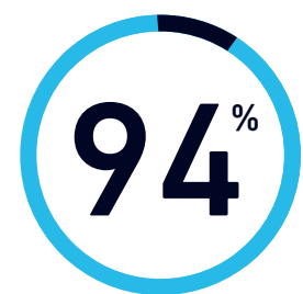
記録と情報の管理

情報ガバナンスに関して 20 以上の事項が特定されました。上位 5 項目は以下のとおりです。