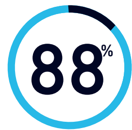
コンプライアンス